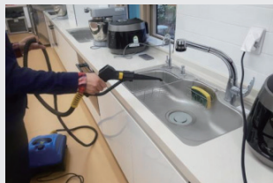
센터 정기 소독