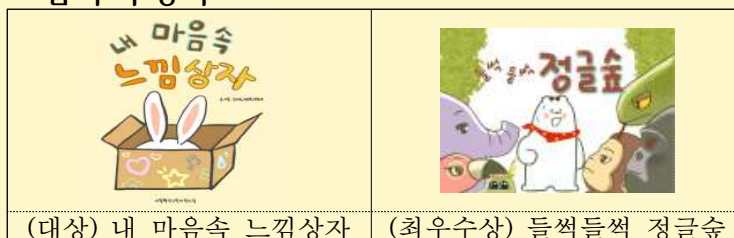
(대상) 내 마음속 느낌상자